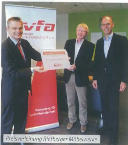
Preisverleihung Rietberger Möbelwerke

Die Rietberger Möbelwerke wurden am 26. Juni 2012 vom bvfa mit dem Gütesiegel „Sprinkler Protected“ für hervorragenden Brandschutz durch eine Sprinkleranlage ausgezeichnet. Das inhabergeführte Unternehmen hat aus Überzeugung viel in die Sicherheit des topmodernen Montage- und Logistikwerks investiert. Der Brandschutz ist auf hohem Niveau. In der 19.000 Quadratmeter großen Produktions- und Logistikhalle mit Verwaltungsräumen sind über 4.000 Sprinkler installiert. Eine Funkenlöschanlage sorgt an den Absaugungen der Holzmaschinen für den Schutz der Filteranlagen. Die Brandmeldeanlage steuert